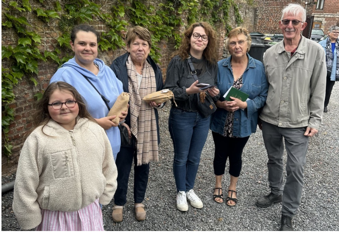
la distribution des cadeaux

Cette décision ne peut répondre au souhait des personnes demandant une absence d'éclairage la nuit mais leur concède une diminution importante de la luminosité.