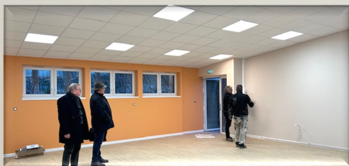
Réhabilitation énergétique école Salengro