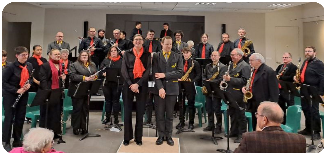
Les 2 harmonies à la fin du concert

Merci aux deux harmonies pour cet après-midi au cours duquel les spectateurs ont fait le plein d'ondes positives.