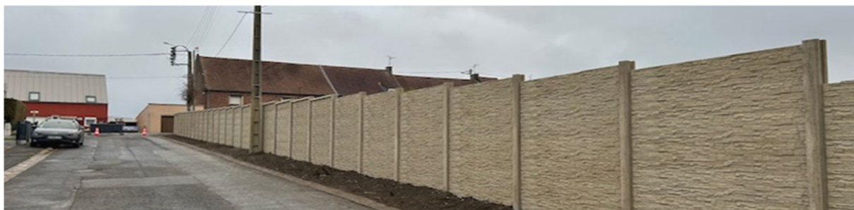
Clôture rue de la Paix

Des travaux de réhabilitation énergétique ont commencé à l'école Roger Salengro.