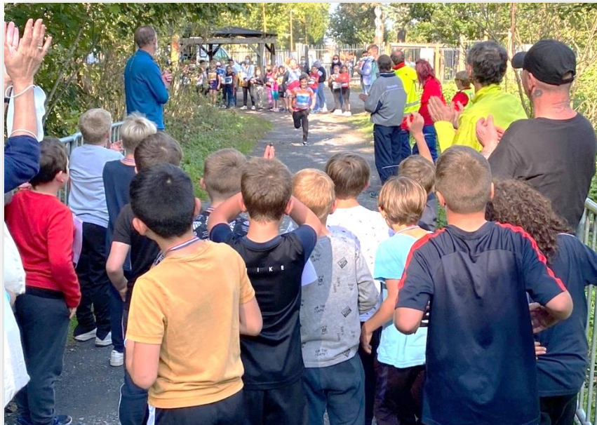
Un nouvel élève dans le groupe scolaire :

Après l'effort, un goûter offert par le CAL a été apprécié des sportifs.